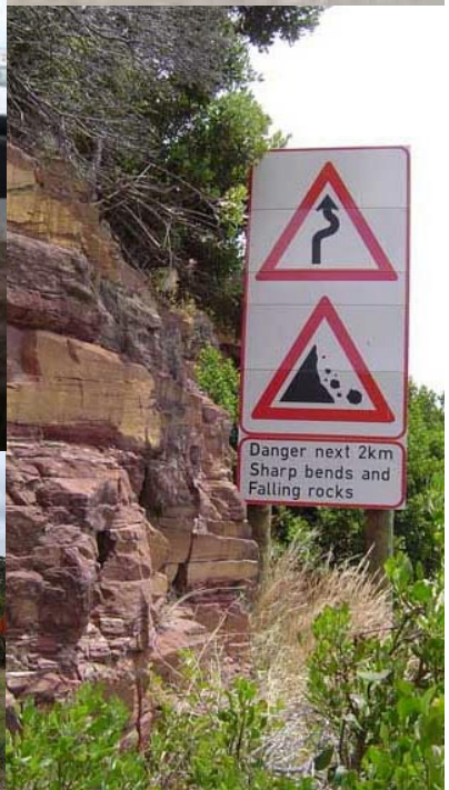
Im Miet-Oldtimerkonvoi durch die Winelands mit Abstechern zu den Straßenhändlern. Cruisen durch Camps Bay und dann über den Chapman & 180 Peak Drive – gesäumt von Felsen und afrikanischen Pflanzen. Beladen auf afrikanisch: Fangfrischer Fisch, bis irgendwann die Federung aufgibt

Chapman Peak den Jaguar in seinem Vorwärtsdrang bremst. Darin ein Ehepaar, beide um die 60 mit sonnengegerbten Gesichtern in stilvoller Bekleidung. Die Sonnenbrillen sind genauso alt und passend wie der SL, das Kopftuch der Dame in klassisch britischem Design, ebenso wie die Schirmmütze des Chauffeurs. So sehen Herrenfahrer aus. Der V8 des SL brabbelt vornehmdezent vor sich hin, die beiden Pensionäre nehmen sich für diese Strecke alle Zeit der Welt.