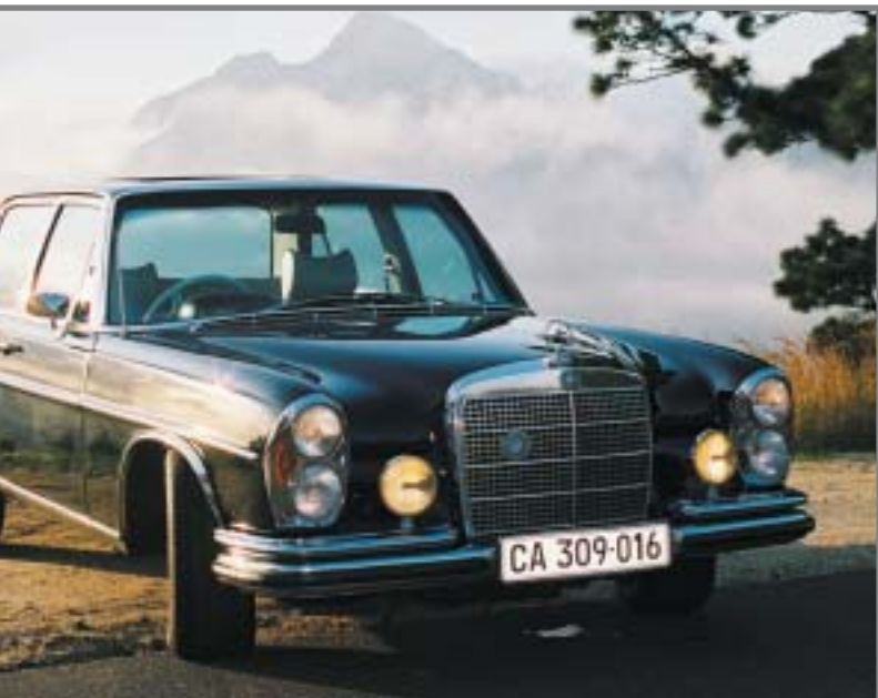
Mercedes 300 SEL 6.3 1971/6300cc/250 PS/8 Zyl. Automatik/Rechtslenker

Von allen Fahrzeugen, die die Firma Jensen je herstellte, ist der Interceptor III der Herausragendste. Insgesamt existieren weltweit nur noch etwa 800 Exemplare! Bei dem Exemplar von MOTOR CLASSIC handelt es sich um eines von drei damals nach Südafrika exportierten Fahrzeugen. Das Interieur mit seinem flugzeugähnlichen Cockpit ist atemberaubend. Die bequemen Sitze aus Connollyleder bieten hervorragenden Sitzkomfort und die überdimensionale Klimaanlage sorgt nicht nur dafür, daß Sie bei afrikanischen Temperaturen entspannt touren können, sie kühlt auch gleichzeitig Ihren Champagner. Das sicherlich beeindruckendste Erlebnis ist die unglaubliche Kraftentfaltung des 7,2 Liter und 370 PS starken Triebwerks, welches Sie über die Straßen gleiten läßt! Fahren Sie mit diesem einmaligen Automobil bei den elegantesten Hotels im Western Cape vor. Ein wirklich großartiges Auto, das 1973 gebaut wurde. Auch James Bond hätte es zweifellos zu schätzen gewußt!