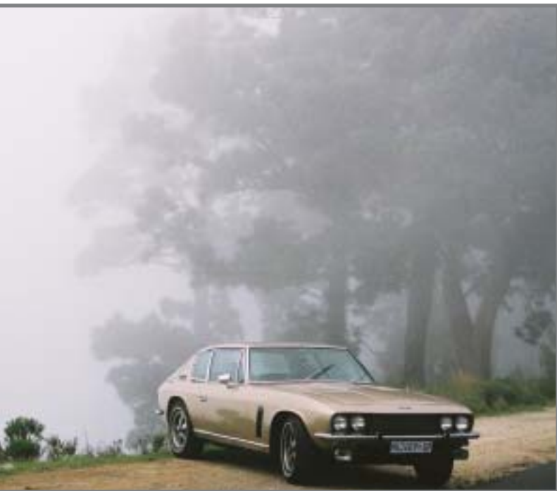
Jensen Interceptor III 1973/7200cc/370 PS/8 Zyl. Automatik/Rechtslenker

Von allen Fahrzeugen, die die Firma Jensen je herstellte, ist der Interceptor III der Herausragendste. Insgesamt existieren weltweit nur noch etwa 800 Exemplare! Bei dem Exemplar von MOTOR CLASSIC handelt es sich um eines von drei damals nach Südafrika exportierten Fahrzeugen. Das Interieur mit seinem flugzeugähnlichen Cockpit ist atemberaubend. Die bequemen Sitze aus Connollyleder bieten hervorragenden Sitzkomfort und die überdimensionale Klimaanlage sorgt nicht nur dafür, daß Sie bei afrikanischen Temperaturen entspannt touren können, sie kühlt auch gleichzeitig Ihren Champagner. Das sicherlich beeindruckendste Erlebnis ist die unglaubliche Kraftentfaltung des 7,2 Liter und 370 PS starken Triebwerks, welches Sie über die Straßen gleiten läßt! Fahren Sie mit diesem einmaligen Automobil bei den elegantesten Hotels im Western Cape vor. Ein wirklich großartiges Auto, das 1973 gebaut wurde. Auch James Bond hätte es zweifellos zu schätzen gewußt!