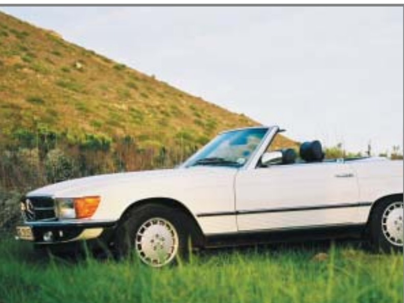
Mercedes 280 SL Cabrio 1981/2800cc/177 PS/6 Zyl. Automatik/Rechtslenker

Diese Limousine wurde 1989 zum großartigsten Sedan der Welt gekürt. Unglaubliche 550 N.M. lassen den 300 SEL 6.3 über die Straßen fliegen. Mit einem 300 SEL 6.3 reist es sich angenehmer und stilvoller über die Kap-Halbinsel als mit einem Wagen der neuen S-Klasse. In der originalen Mercedes Broschüre wurde der 300 SEL 6.3 so beschrieben: Die Fahrzeugtechnik, Leistung und Sicherheit von Morgen – Merkmal der ‚Neuen Generation‘ von Mercedes-Benz. Der 300 SEL 6.3 – eines der herausragendsten, leistungsstärksten Autos der Welt. Ein Automobil für den anspruchsvollen Fahrer, der nur das Beste gewöhnt ist. Nur wenige Autos dieser Welt bieten solchen Luxus und solche Leistung. Luxuriöse Fahrkabine für fünf Personen; Beschleunigung von 0 auf 100 km/h in 6,5 Sekunden.